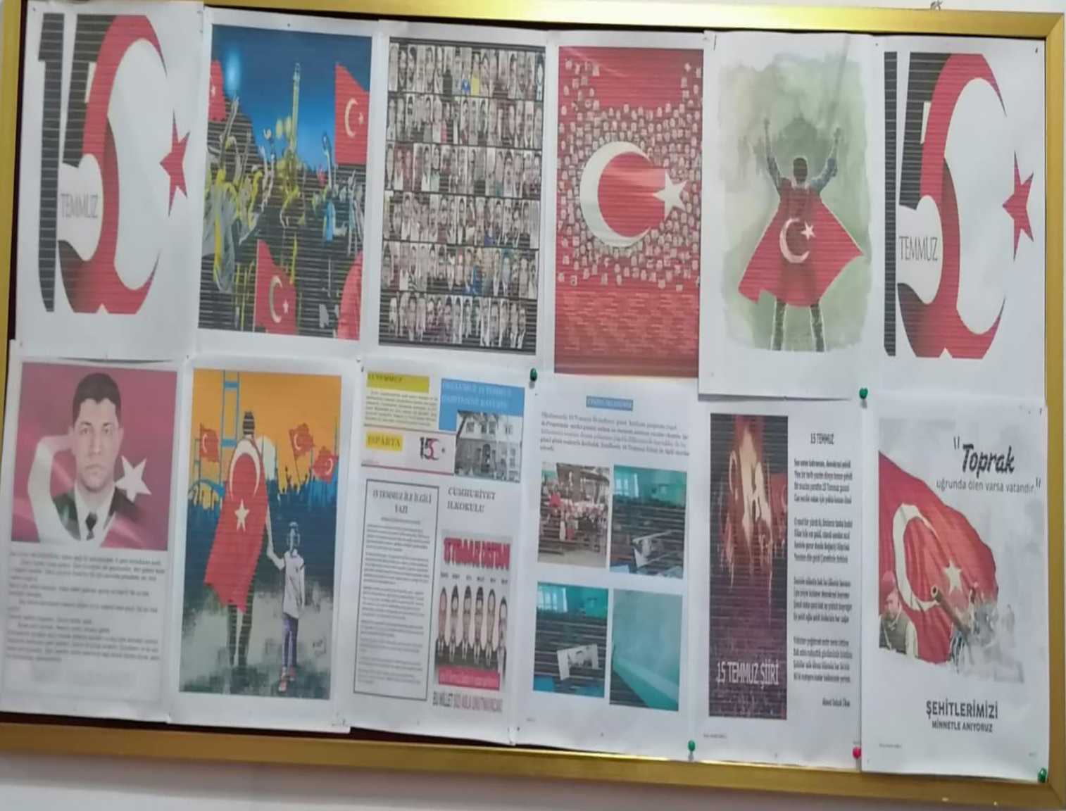
15 TEMMUZ DEMOKRASI VE MİLLİ BİRLİK GÜNÜ OKUL PANOSU